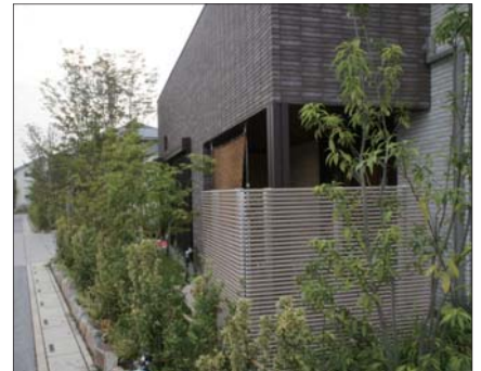
写真3 クールルーバーを設置した住宅

クールルーバーの効果の検証では、STREAM®で住宅周辺の気温・風向風速分布をシミュレーションし（図2）、ThermoRenderで表面温度分布をシミュレーションした（図3）。「ルーバーのシミュレーションでは細かいメッシュで解くと手間と時間がかかるので、『多孔質体』として設定しました。ボックスの中に固体部と流体部が混在している設定としています。さらに固体の物性値と空隙率を