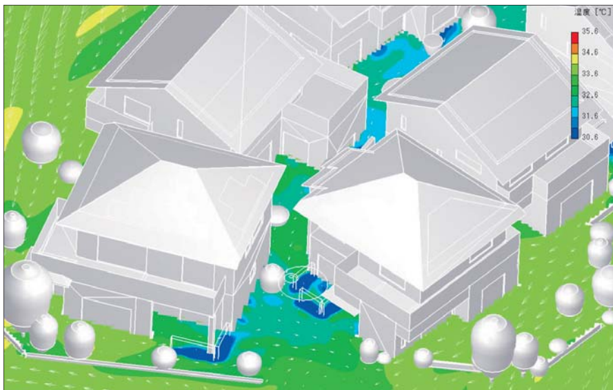
図2 気温・風向風速分布によるクールルーパーの設計検討

てきます。そうしてピンポイントで対策を打ちやすくなる。自分のポテンシャルを上げさせてもらっていると感じます」。