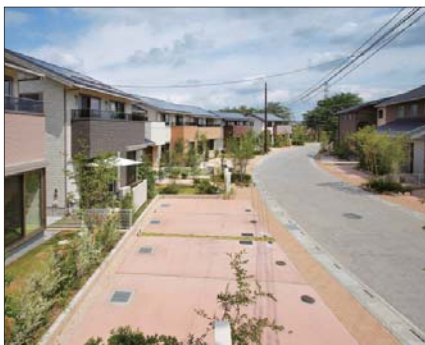
写真2 「エムスマートシティ熊谷」

放射温度を下げる取り組みとして特筆すべきは、新たに部材から自社開発した「クールルーバー」の大々的な採用だ（図1）。「地面への打ち水は足元の温度を下げ