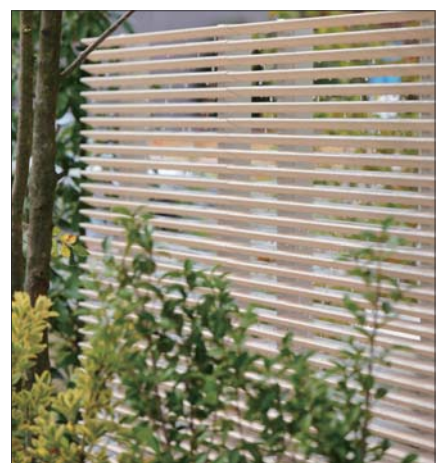
写真4 クールルーバー

入力し、さまざまな風速で個別に計算したうえで関数化した抵抗値を与えています」と平山氏。クールルーバーの周りでは冷えて拡散していく様子などが、画像でわかりやすく確認できる。表面形状と表面温度を的確に捉えるため、ハイブリッドメッシュを採用した熱流体シミュレーションソフトウェアSCRYU/Tetra®も併用し、STREAM®に落とし込んだ。クールルーバーについて「ほぼ狙い通りの効果がありました」と平山氏は胸を張る。