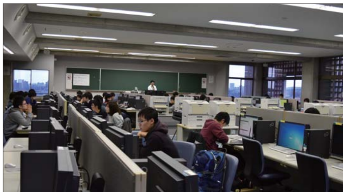
写真2 航空システム工学科「数値シミュレーション」授業風景

講義の4つ目のテーマでは、用意された翼型のモデルを使用するか、または自分の計算したいもののモデルを用意して解析を行い、レポートを提出する。物性や流れの情報を設定したりするため、自分で調べなければ解析ができない。昨年は半数ほどが各自の興味のあるものを解析し、すでにある翼型に独自のパーツを取り付けて性能がどう変わるかを調べたり、アイスホッケーのパックの動きを調べた学生がいたそうだ。