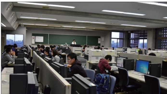
写真2 航空システム工学科「数値シミュレーション」授業風景

講義の4つ目のテーマでは、用意された翼型のモデルを使用するか、または自分の計算したいもののモデルを用意して解析を行い、レポートを提出する。物性や流れの情報を設定したりするため、自分で調べなければ解析ができない。昨年は半数ほどが各自の興味のあるものを解析し、すでにある翼型に独自のパーツを取り付けて性能がどう変わるかを調べたり、アイスホッケーのバックの動きを調べた学生がいたそうだ。